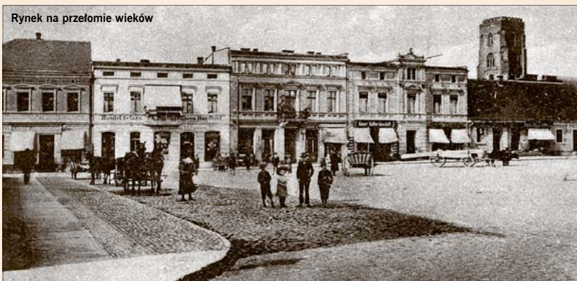
Rynek na przełomie wieków